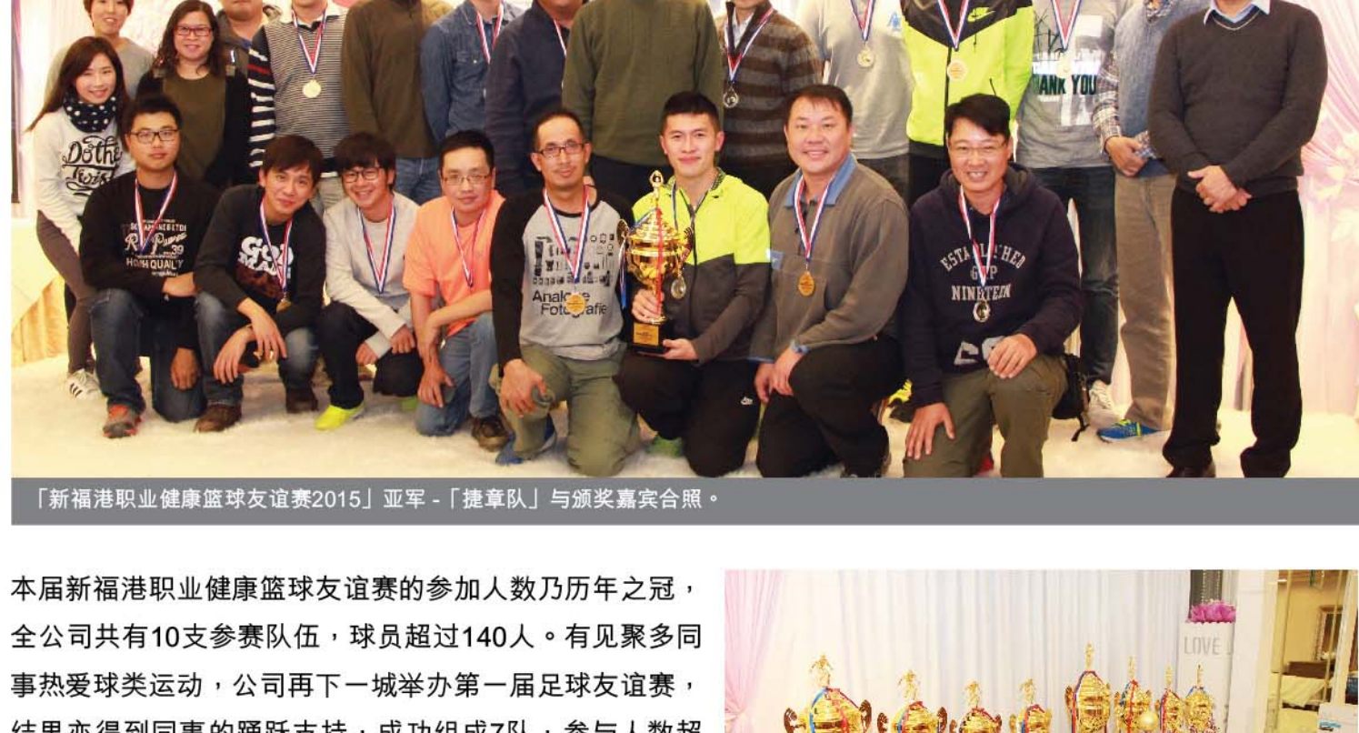
「新福港职业健康篮球友谊赛2015」冠军-「迪士尼队」与颁奖嘉宾合照。

新福港于2016年3月11日为「新福港职业健康篮球友谊赛2015」及「新福港职业健康足球友谊赛2015」举办颁奖晚宴。经过多场激烈赛事，「新福港职业健康篮球友谊赛2015」的冠军最终由「迪士尼队」夺得；而「新福港职业健康足球友谊赛2015」的冠军则由「机场及精英联队」夺得。