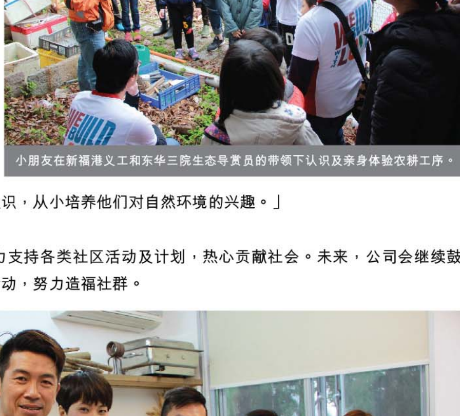
小朋友在新福港义工和东华三院生态导赏员的带领下认识及亲身体验农工序。

新福港共有50名义工参与是次活动。一众义工和小朋友在导赏员的带领下参观及认识农场内的动植物，并亲身体验包括开地、翻土、移苗、浇水、施肥和防虫害等农工序，还一起即场制作和品尝鸡屎藤茶糕，彼此乐也融融，度过了非常愉快和充实的一天。