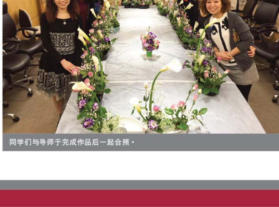
同学们与导师于完成作品后一起合照。

小原流花道为日本三大主流花道之一。有别于坊间寻常的花艺，小原流花道是一种以色彩美为中心，并结合了季节美和形态美的花材造型艺术。它提倡天、地、人之间的统一和谐，注重人与自然的共生，蕴含着深厚的文化哲理。