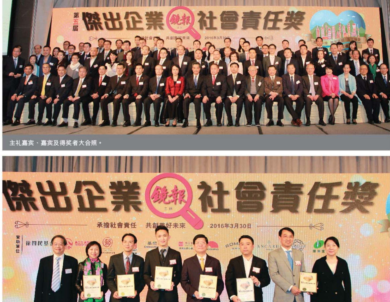
主礼嘉宾、嘉宾及得奖者大合照。

新福港集团连续五年获《镜报》月刊颁发「杰出企业社会责任奖」，再次肯定集团于履行社会责任方面的努力。是次颁奖典礼于本年度3月30日在九龙尖沙咀唯唯酒店宴会厅举行，并邀得香港特别行政区行政长官梁振英先生担任主礼嘉宾。