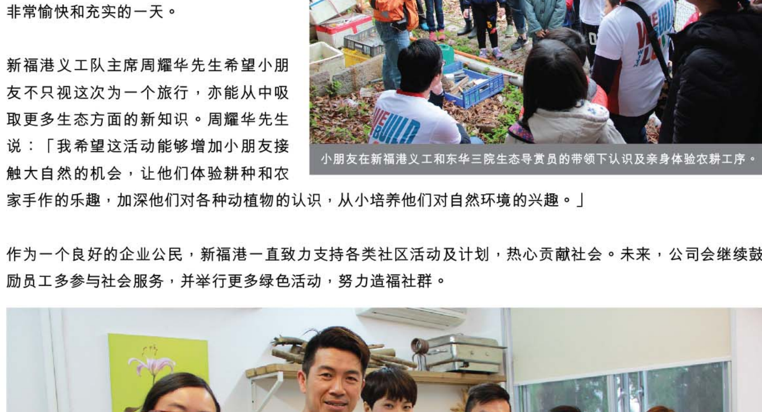
新福港义工与小朋友们于「亲亲大自然之旅2016」活动中合照。

为了宣扬绿色讯息及加强儿童对保护生态环境的意识，新福港于2016年3月13日与东华三院单车生态旅游社会企业合办「亲亲大自然之旅2016」，由新福港义工和东华三院的导赏员一同带领40多名来自天水围基层家庭的小朋友参观元朗南生围敬辉农场，透过不同的活动加深对大自然生态的认识和了解。